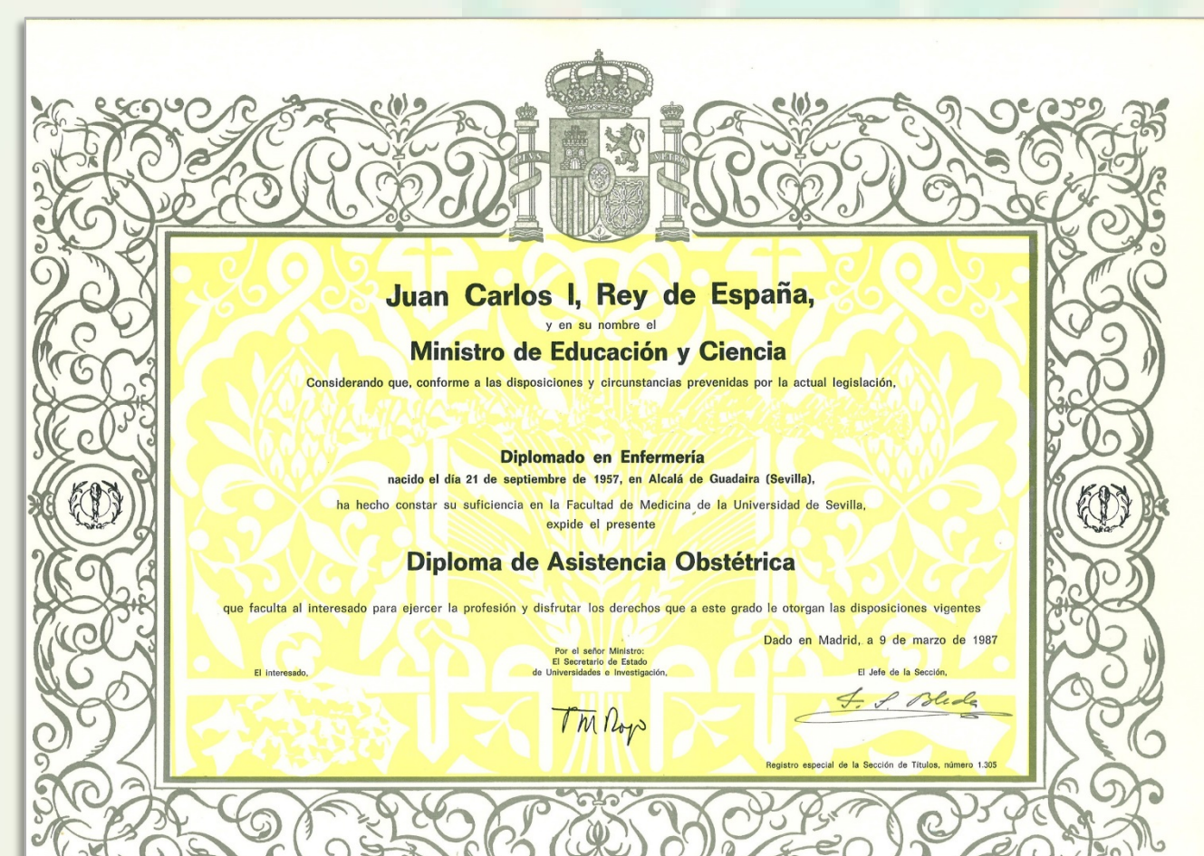
IMAGEN 6.2. Diploma de Especialista en Asistencia Obstétrica (Matrona). Primera especialidad de la Diplomatura de Enfermería: Matrona