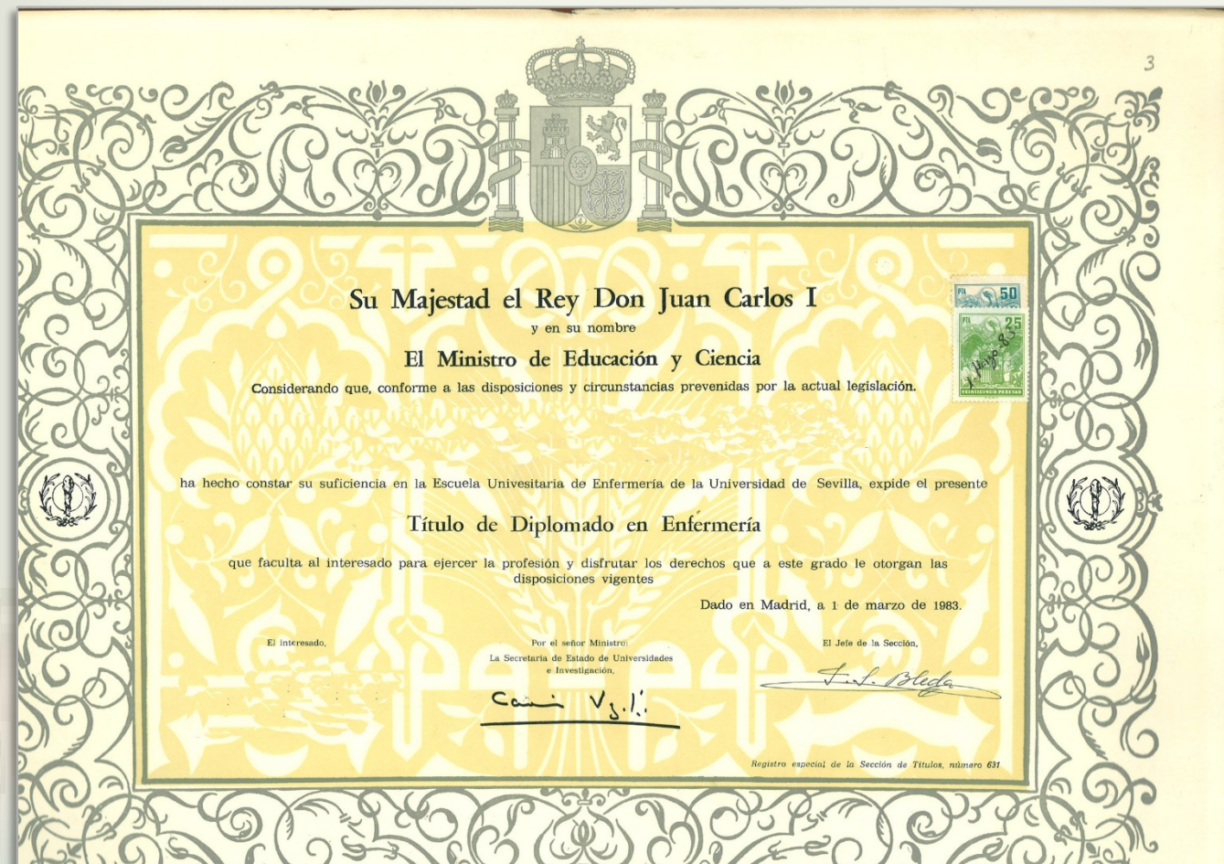
IMAGEN 6.1. Título de Diplomado en Enfermería. A partir de 1982 la Escuela de Enfermería de Sevilla expide el título de Diplomado en Enfermería

Las reivindicaciones que hace la Enfermería desde comienzos de los años 70 del siglo pasado dan sus resultados al ser reconocida como carrera de rango universitario de Primer Ciclo y salir la primera promoción de titulados (1978-1981). Fue un hito histórico para la profesión. Desde entonces, se abrió un intenso debate en el seno de la Enfermería que le ha llevado a reclamar y conseguir los restantes niveles académicos.