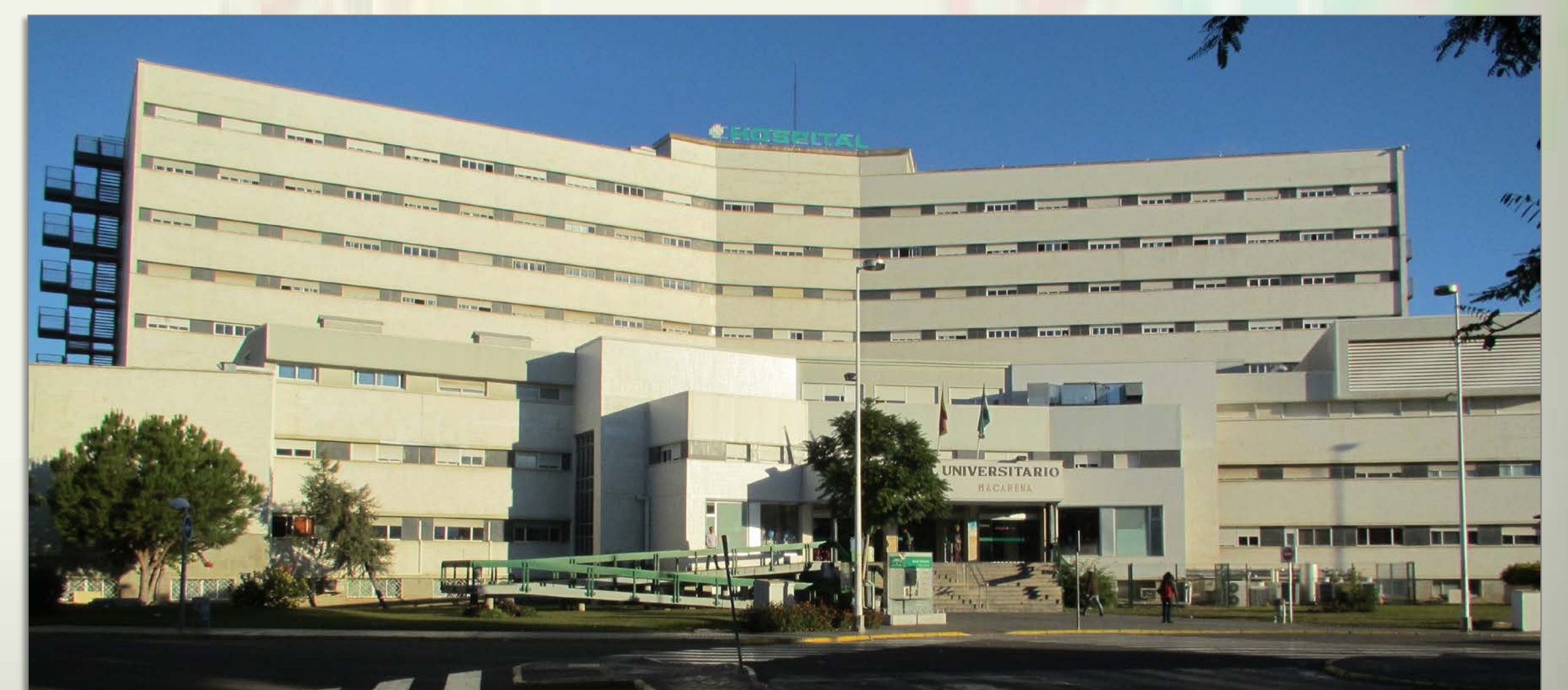
IMAGEN 6.9 Hospital Universitario Virgen Macarena. Comenzó su actividad docente en 1974 y en él se han formado desde entonces las últimas generaciones de A.T.S., todas las de Diplomado y las actuales de Grado