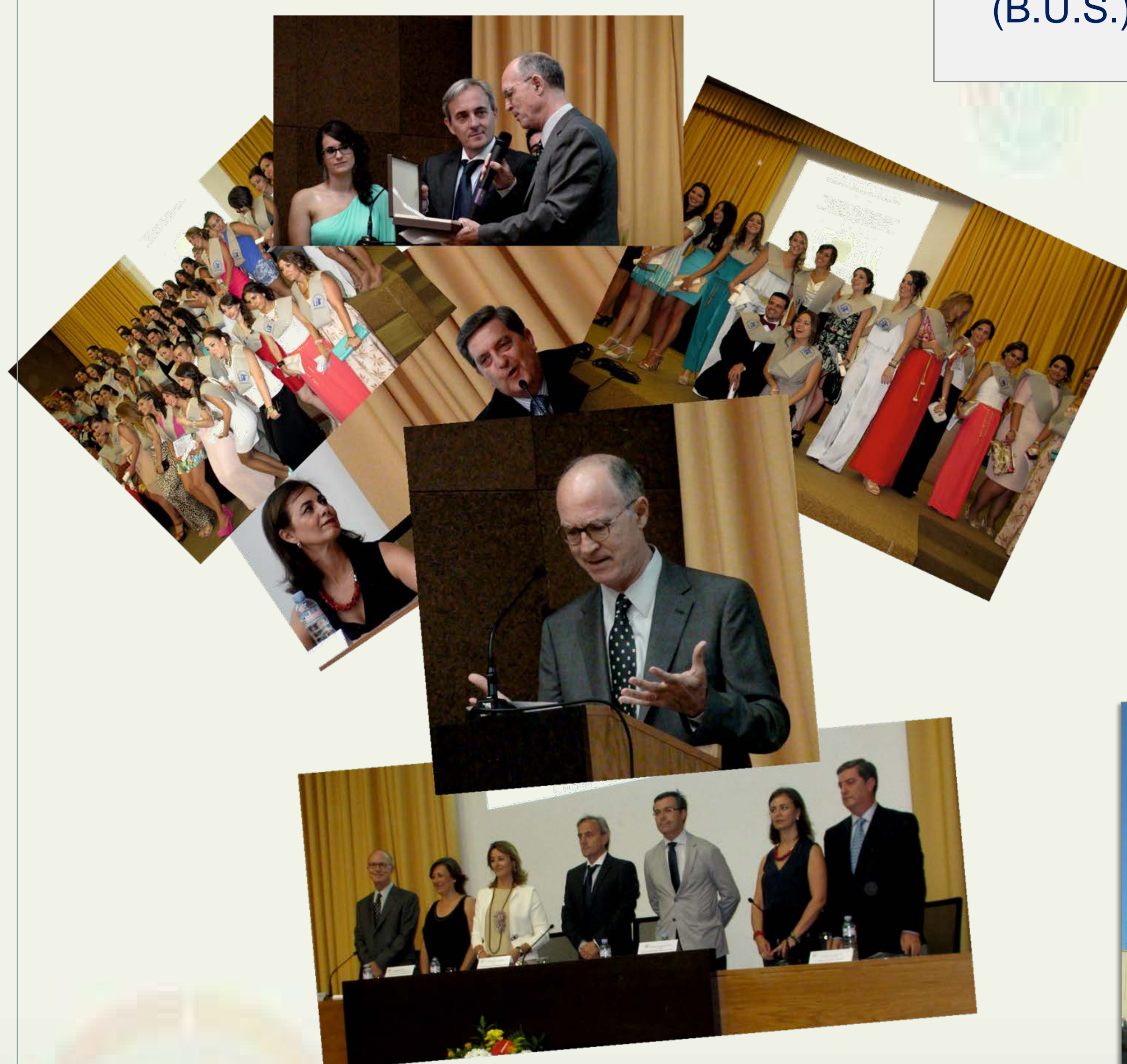
IMAGEN 6.7. Acto de Graduación de la segunda promoción de Grado en Enfermería (2010-214) (Colección particular. Híades. Revista de Historia de la Enfermería)